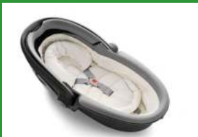
Автокресло «люлька» группы 0 для детей массой менее 10 кг

Детские удерживающие устройства подразделяют на 5 весовых групп: