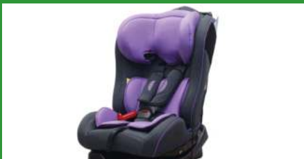
Автокресло группы II для детей массой 15-25 кг